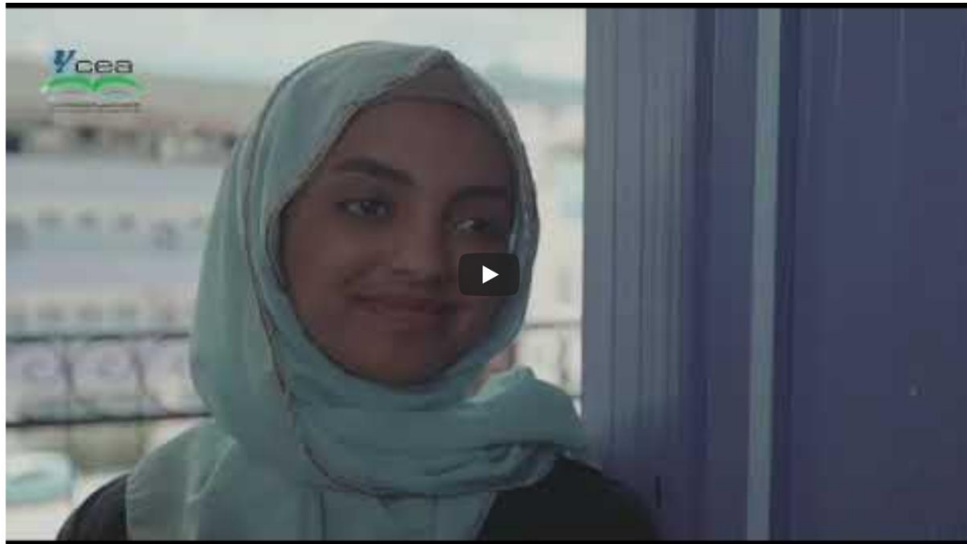
فلاش توعوي عن التعليم ضمن #فعاليات_اسبوع_العمل_العالمي_التعليم_2023.

https://www.youtube.com/watch?v=hcOnqTodlc8